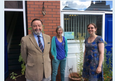
Aelodau tîm Menter Caerdydd a'r Fro dros Iechyd Meddwl ar Trade Street, ger Williams Court

anghenion ynghynt a hynny yn lleol iddo ef. Mewn partneriaeth â Chlwstwr Meddygon Teulu de-orllewin Caerdydd a phartneriaid eraill megis C3SC, Cymunedau yn Gyntaf ac Iechyd y Cyhoedd, mae'r Bartneriaeth Cymdogaeth yn ffurfio grŵp dan arweiniad meddygon teulu gyda'r bwriad o lunio proses gyfeirio fel yr uchod ar gyfer meddygon teulu. Mae C3SC a Chymunedau yn Gyntaf eisoes yn cefnogi llawer o grwpiau iechyd meddwl ac mae Menter Caerdydd a'r Fro dros Iechyd Meddwl wedi cynnig eu cyfleuster ar-lein er mwyn creu cyfeirlyfr grwpiau. Bydd y grŵp gorchwyl yn ystyried cynlluniau sydd eisoes yn bodoli (yn cynnwys swyddi "Cyfeirydd Cymdeithasol" a