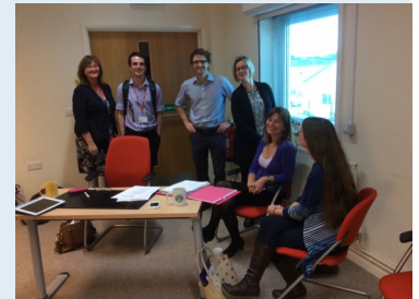
Aelodau Clwstwr Meddygon Teulu de-orllewin Caerdydd yn cwrdd ym Meddygfa Lansdowne

chynlluniau gwirfoddoli) ac yn awgrymu'r opsiynau gorau.