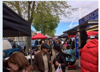
Marchnad Glan-yr-afon, gyferbyn â